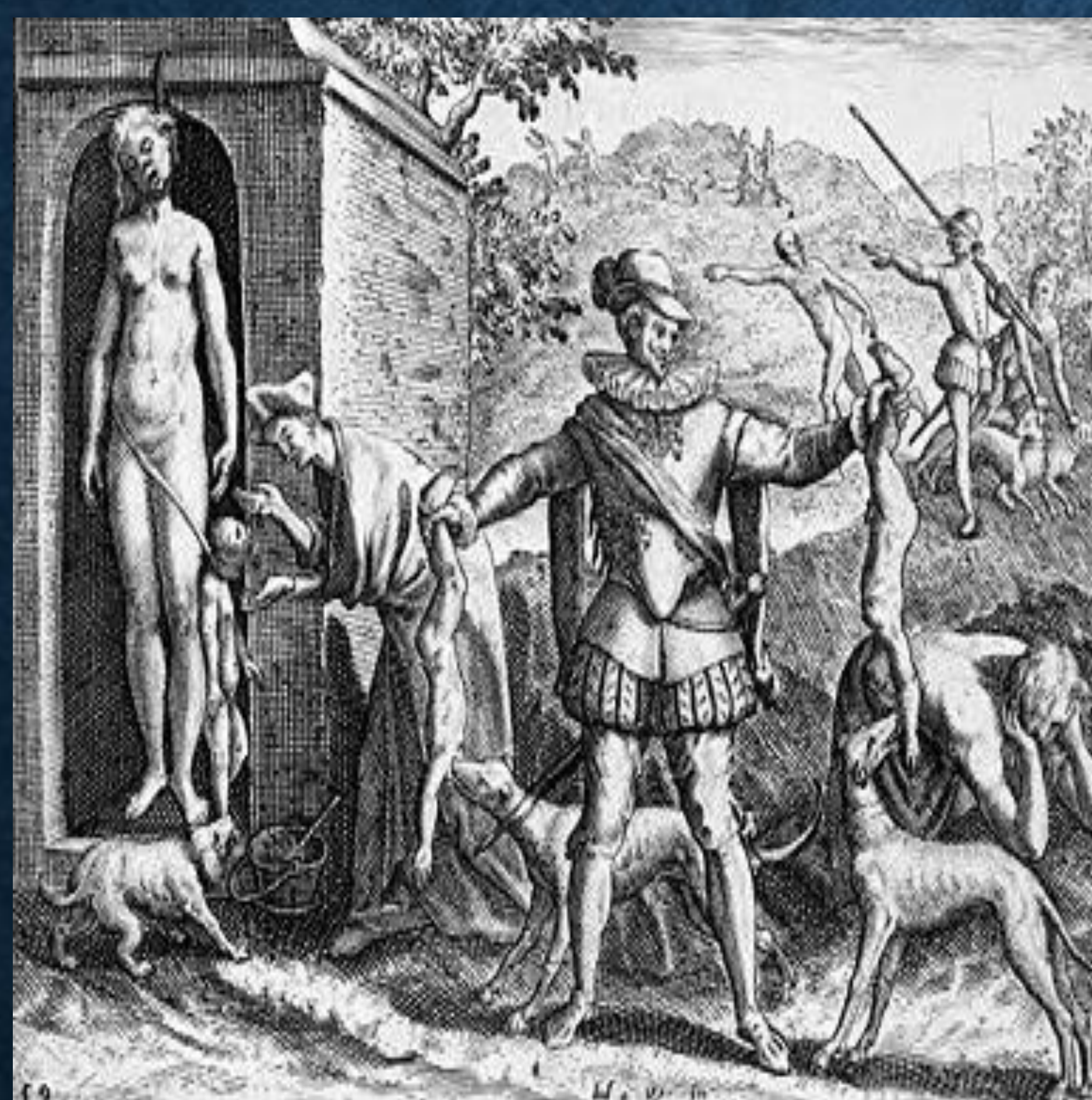
Un grabado de Theodor de Bry

Tesis: Este trabajo explora las posibles razones de la difusión de la Leyenda Negra de las colonias españolas y aborda el tema de los trabajos que se han hecho para combatirla.