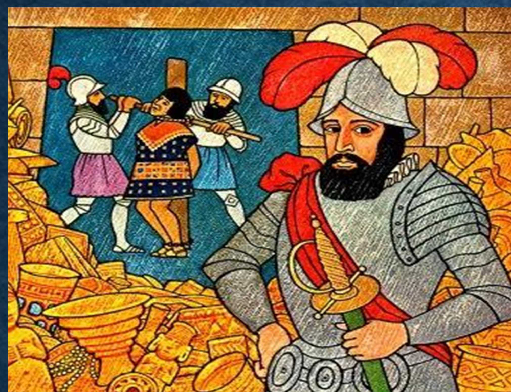
Una representación visual contemporánea de lo que la leyenda negra promovía